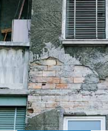
Edificio degradato che necessita di un intervento di recupero