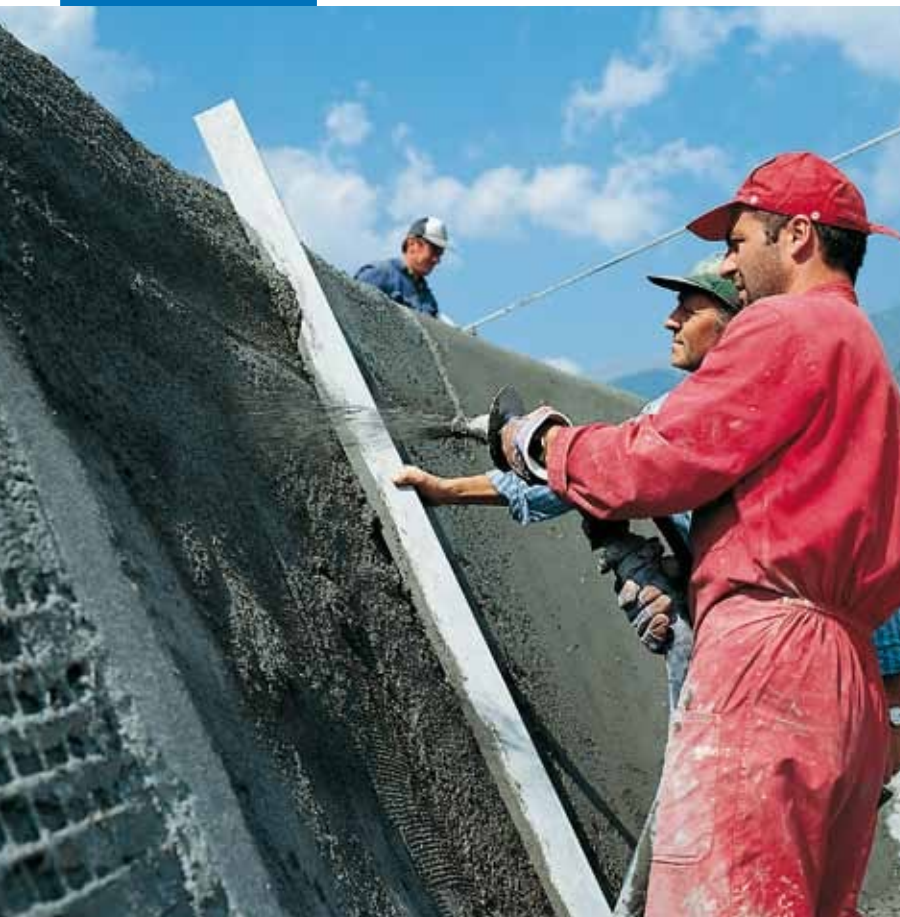
Applicazione di Mapegrout T40 con macchina intonacatrice