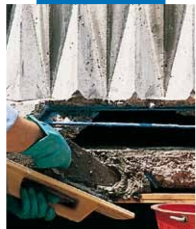
Esempio di riparazione di un balcone con Mapegrout T40