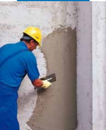
Applicazione con spatola