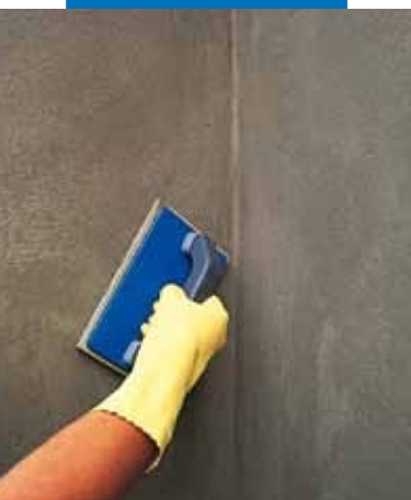
Finitura con frattazzo di spugna